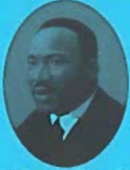
MARTIN LUTHER KING JR. DAY